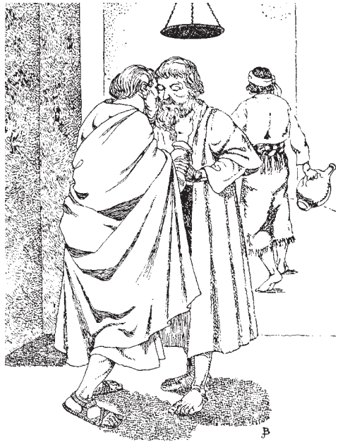
●法利賽人西門會見客人

不一會兒，客人們陸陸續續到了。西門迎上前去招呼他們，和他們親臉，他的僕人則端水來給客人們洗腳。小朋友，你們可能會感到奇怪：「怎麼會有這種迎接客人的方式呢？」其實，這沒有什麼，親臉和洗腳是猶太人迎接客人的傳統禮儀。跟客人親臉表示問安的意思。洗腳呢？是因為猶太人平常走路穿的是涼鞋，走在路上難免會有許多的砂石和塵土沾在腳